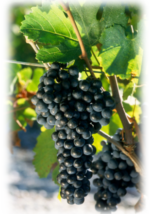
Merlot du Château Vieux Planty