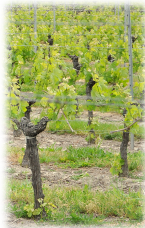
老普兰缇城堡的葡萄树